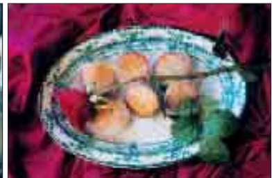
Autor: João Santiago