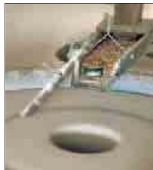
Sub-tema: Actividades Económicas