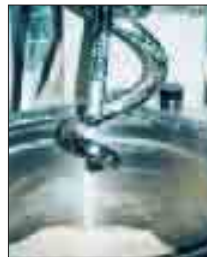
Autor: Ana Pignatelli