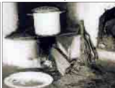
Autor: Nidia Anunciação