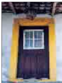
Autor: João Santiago