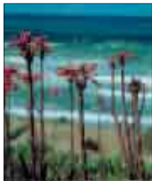
Autor: Mário Silva